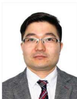
Г.ЭРДЭНЭБУЛГАН ЗГ-ийн хэрэг эрхлэх газар, Хууль, эрхзүйн газар, Засгийн газрын референт