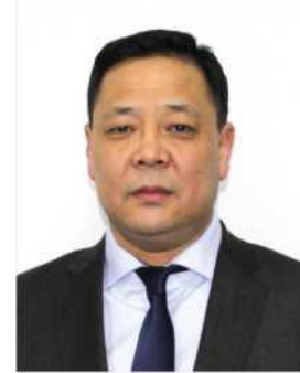
Ц.НОРОВЖАМЦ Интер аудит ХХК-ийн гэрээт аудитор

2018 онд Төлөөлөн удирдах зөвлөлийн нийт 9 хурлаар 26 асуудлыг хэлэлцсэн байна. Үүнээс батлагдсан-22, хойшлуулсан-1, танилцуулсан-3 асуудал байна.